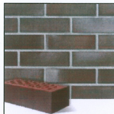
CEGŁA KLINKIEROWA - Roben ADELAJDA / NF / 19 BURGUND GŁADKA WYMIAR : 240 x 115 x 71 [mm]